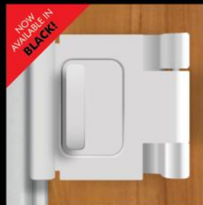
Door Guardian Outswing